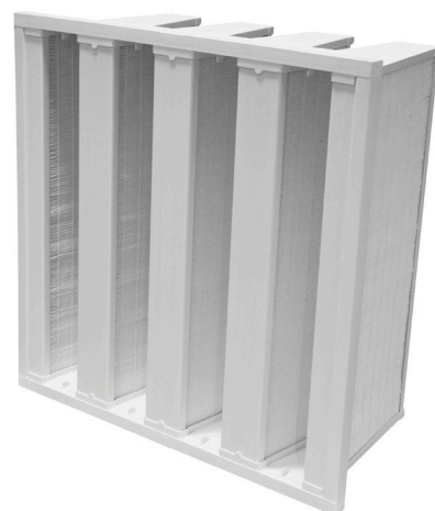
Perte de charge