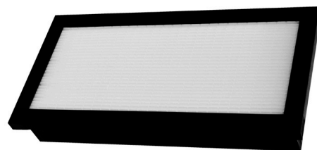
Perte de charge