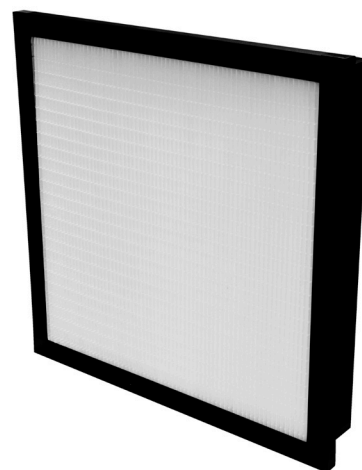
Perte de charge