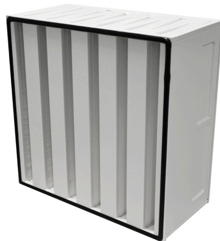
Perte de charge