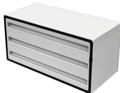
Perte de charge