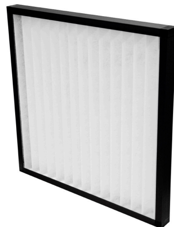
Perte de charge