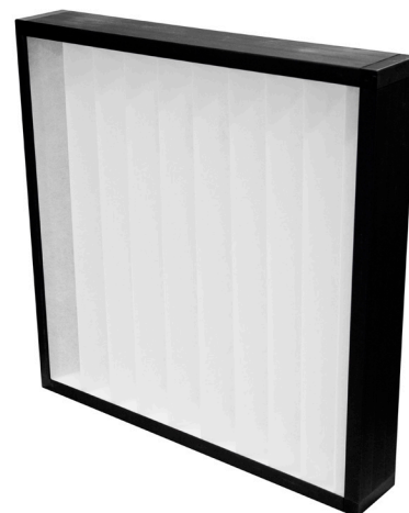
Perte de charge